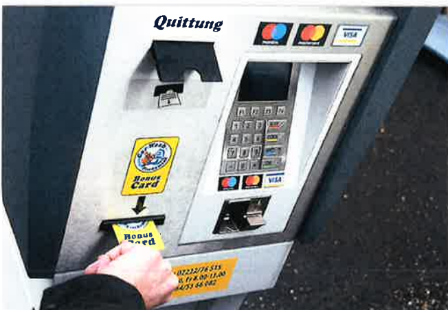
Bedienterminal für das Kartengeschäft

Es gibt in der carwash Branche zwei wirklich große Herausforderungen: Die Kunden in die Anlagen zu bringen und dann auch passendes Personal zur Stelle zu haben. Letztgenanntes ist auch bei Tagungen immer wieder ein großes Diskussionsthema. WashTec probiert jetzt in Österreich das neue Konzept der „personalfreien Waschcenter“. Sprich: Investoren bringen zuerst einen Koffer voll Geld und holen dann alle paar Tage die Einnahmen ab? Ganz so einfach ist es dann doch nicht, denn in der Praxis gibt es einige Hürden zu überwinden.