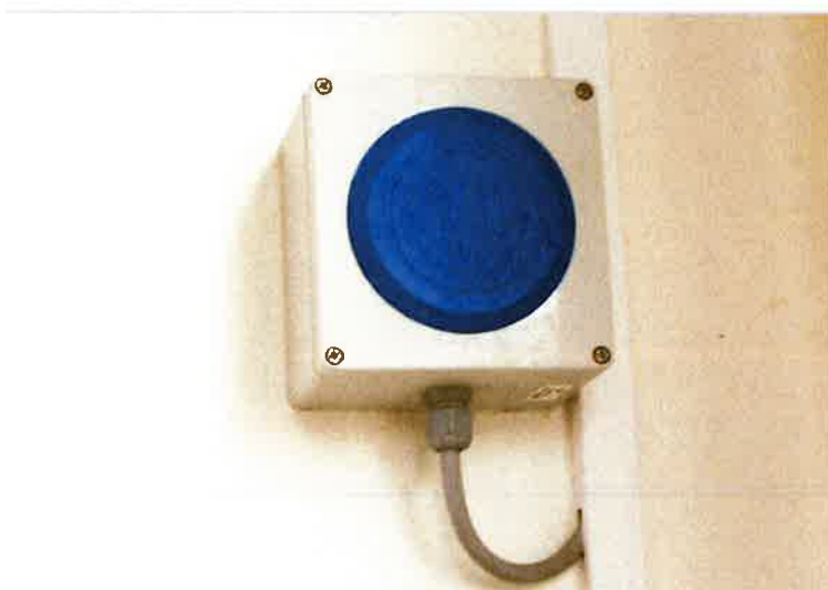
Die Hup-Stopp-Automatik reagiert sofort

Um die Genehmigung für die Anlage zu erhalten, mussten z. B. in der Portalanlage zusätzliche Seitenabstandsschutzschutze montiert und eine Hup-Stopp-Automatik bei Betrieb der Anlage installiert werden. Wenn der Kunde während der Wäsche im Auto sitzt und ein Problem auftritt, muss der Stillstand der Anlage ausgelöst werden, sobald der Autofahrer einmal lange auf die Hupe drückt. Desweiteren müssen sich