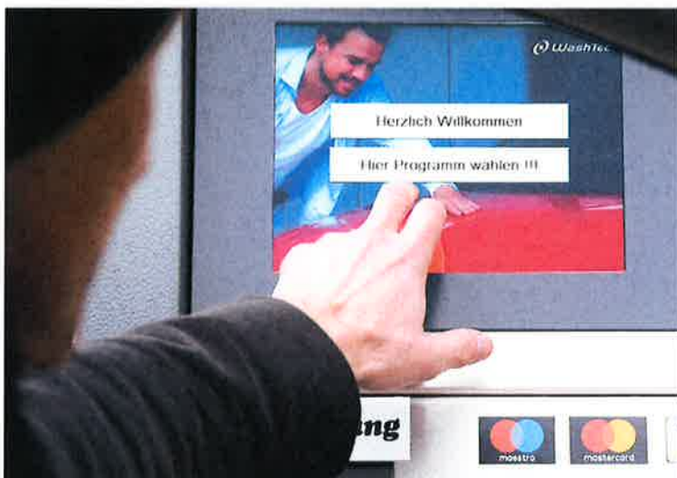
Mit iWash ist die Programmwahl kinderleicht